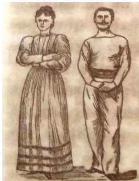
Figura 2. Quinto exercício preliminar Descansar a vontade