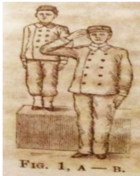
Figura 1. Primeiro exercício preliminar Sentido

A busca pela consciência do alinhamento das partes do corpo e do olhar, remete a uma presente educação dos sentidos. Um genuíno aluno da escola republicana possuía um tronco apurado, ventre recolhido e movia-se com o olhar para frente, e tais sentidos cinestésicos formavam sensibilidades em relação ao corpo em movimento e repouso. Não era utilizado no início ocasionalmente, mas sim para que estas percepções se mantivessem durante toda a prática. A angulação dos pés e a posição correta da cabeça é um exemplo desta disciplina com o próprio corpo, prescrita não somente neste primeiro comando, mas também em descansar , descansar a vontade , nos exercícios das voltas , marchas e posições ginásticas fundamentais , onde são encerrados os exercícios militares e iniciados os exercícios ginásticos.