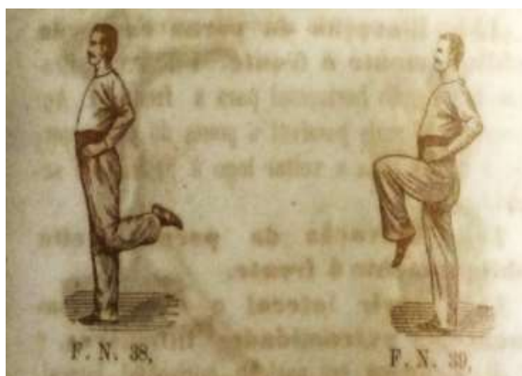
Figura 5. Exercícios Flexão da perna esquerda (à esquerda), permitido às meninas, Flexão da coxa esquerda (à direita), não permitido às meninas