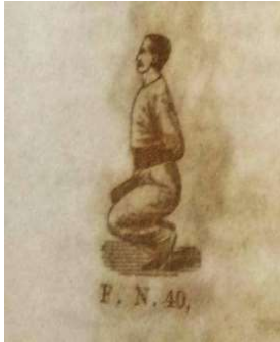
Figura 6. Exercício Flexão simultânea de coxas e pernas , não permitido às meninas

A forma específica destes movimentos, os quais indicavam que as pernas devem se afastar ou se cruzar, eram inadequados às meninas, pois, segundo Baragiola, sua dignidade não deveria ser ofendida pela ginástica na escola.