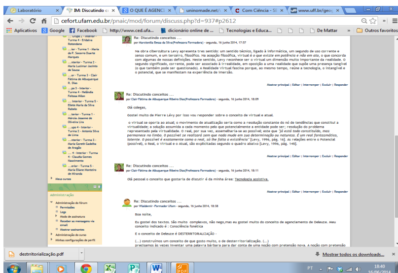
Figura 3 – Fonte: < http://cefort.ufam.edu.br/pnaic/mod/forum/view.php?id=896 >. Acessado em: maio de 2014.

É possível verificar como foi importante a apropriação dos novos conceitos referentes ao plano imanente do PNAIC (programa de formação de professores e distribuição de material didático no campo da Educação Básica). Após a discussão e apropriação de novos conceitos a equipe de Professor-formador teve uma interação muito mais harmônica com a equipe multidisciplinar, responsável pela construção do AVGP para o PNAIC.