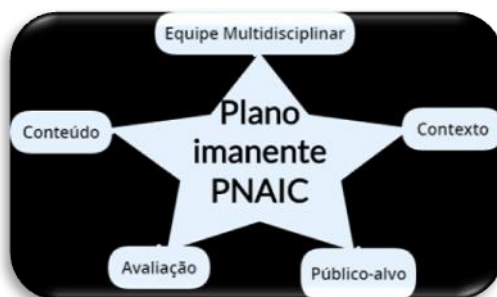
Figura 1 – Plano imanente PNAIC/AM.

Palavras-chave: Plano imanente; cartografia; gestão de conteúdo em AVGP.