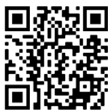
Video de plano