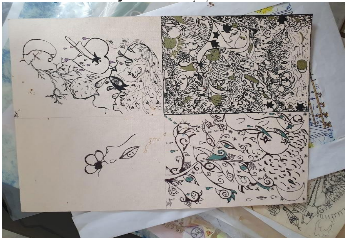
Imagem 3: Desenhos de Inspiração Literária

Meus desenhos, cujo estilo foi direcionado pela leitura de livros: