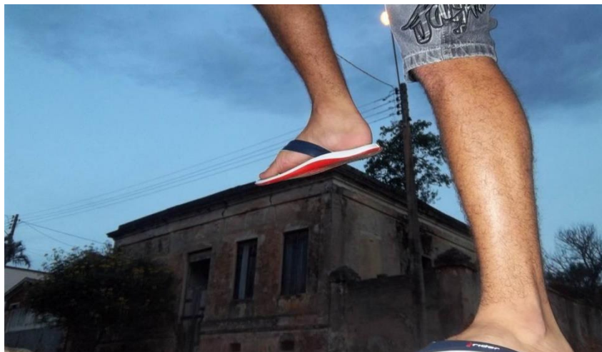
Figura 05: Desimportância (fotografia de G. S., 2014). Arquivo pessoal.

É o mesmo prédio que vemos na figura 04. O movimento do olhar, entretanto, passa despercebido pelo peso da arquitetura. Concentra-se no irrelevante, no que torna absurdamente (ir)real esse mesmo prédio: uma pomba, sobre o frontão com a imagem da padroeira católica do edifício. É a pomba quem merece destaque, quem executará o jogo da ação expressa pelas hashtags das redes sociais. Ela levantará voo. E sujará os carros. E o prédio continuará ali. Movimentos do cotidiano no arredor do patrimônio que o ancoram à importância do banal.