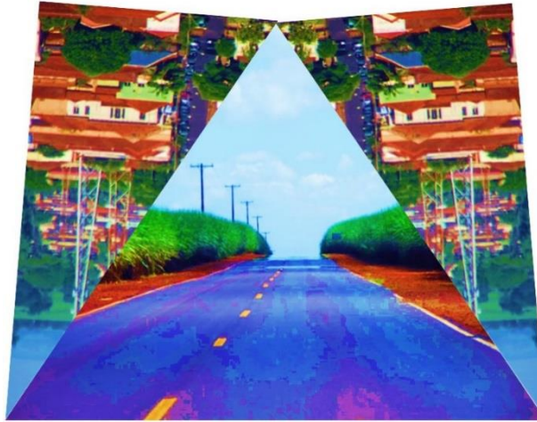
Figura 08: Prédios? (Fotografia de A. D., 2013). Arquivo pessoal.

Em um pequeno município que possui apenas três prédios de andares, o que é utilizar a palavra como sinônimo de construção? É o que se pergunta a fotografia abaixo, em um panorama geométrico da cidade horizontal e ruralizada, que se dobra sobre a estrada vazia no canavial. Prédios? Não seria patrimônio algo de outra ordem?