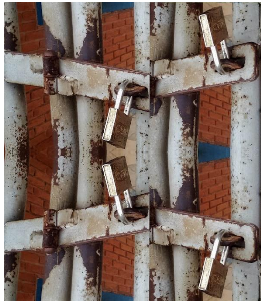
Figura 07: Sem título.

Mas e se esse prédio fechado fosse invadido? Não pelos cidadãos, mas por personagens da ficção? Trariam humor ao edifício? Que tipo de sentidos essa invasão poderia trazer? Que tipo de invasão poderíamos fazer para nos apropriar dos prédios públicos? Uma invasão do olhar?