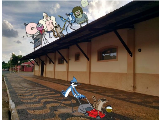
Figura 06: A invasão do cinema (fotografia de I. V., 2013). Arquivo pessoal.

certo tempo, a única sala de cinema de Descalvado. Em 2012, com a falência do empreendimento, essa ala do prédio foi fechada ao público.