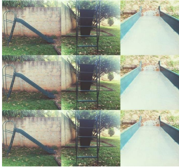
Figura 10: Escorregar (fotografia de J. G., 2015). Arquivo pessoal.

E então a fotografia se torna uma brincadeira de olhar que intui um corpo ali, quase a escorregar no movimento repetitivo das imagens. É o afeto e a infância que se presentificam. Podemos refletir sobre as memórias na construção do patrimônio, mas também é possível imaginar um olhar de criança no tratamento das discussões, um olhar que transita pelo espaço e o explora corporalmente.