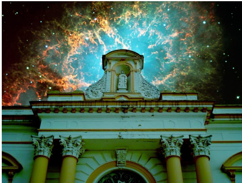
Figura 03: Casarão da Santa Casa (2014).

Proponho nesse movimento de reflexão docente, pensar com as imagens, selecionando, recortando e colando pensamentos construídos coletivamente a partir dos olhares individuais dos estudantes.