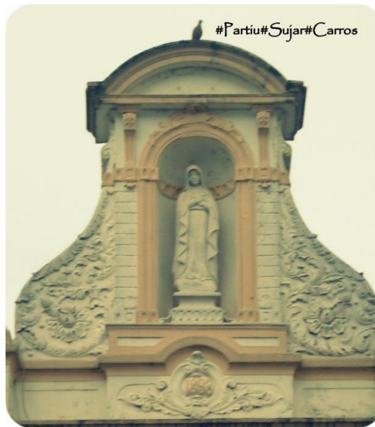
Figura 04: Partiu sujar carros (fotografia de G. C., 2014). Arquivo pessoal.

É o mesmo prédio que vemos na figura 04. O movimento do olhar, entretanto, passa despercebido pelo peso da arquitetura. Concentra-se no irrelevante, no que torna absurdamente (ir)real esse mesmo prédio: uma pomba, sobre o frontão com a imagem da padroeira católica do edifício. É a pomba quem merece destaque, quem executará o jogo da ação expressa pelas hashtags das redes sociais. Ela levantará voo. E sujará os carros. E o prédio continuará ali. Movimentos do cotidiano no arredor do patrimônio que o ancoram à importância do banal.