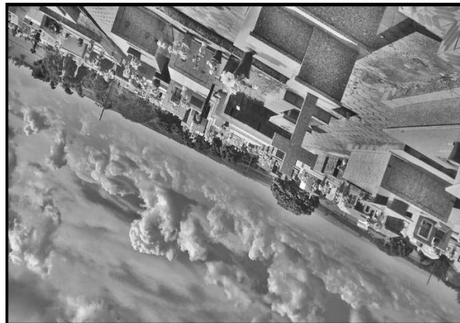
Figura 11: “Das diferenças impostas os mortos nada sabem” (fotografia de C. A., 2013). Arquivo pessoal.

Na contramão da brincadeira, na figura 11, as lápides do cemitério sustentam-se precariamente sobre as nuvens, e parecem se deixar cair no movimento impactante proposto pela linha diagonal da composição. O título da fotografia é extraído do autor Virgílio Ferreira e conduz os pensamentos para as diferenças sociais, que marcam a construção e seleção de um patrimônio. E permite perguntar: será que os mortos não sabem dessas diferenças, quando a própria construção arquitetônica das lápides evidencia a hierarquia social existente em vida? A imagem fotográfica seria capaz de desequilibrar essas hierarquias?