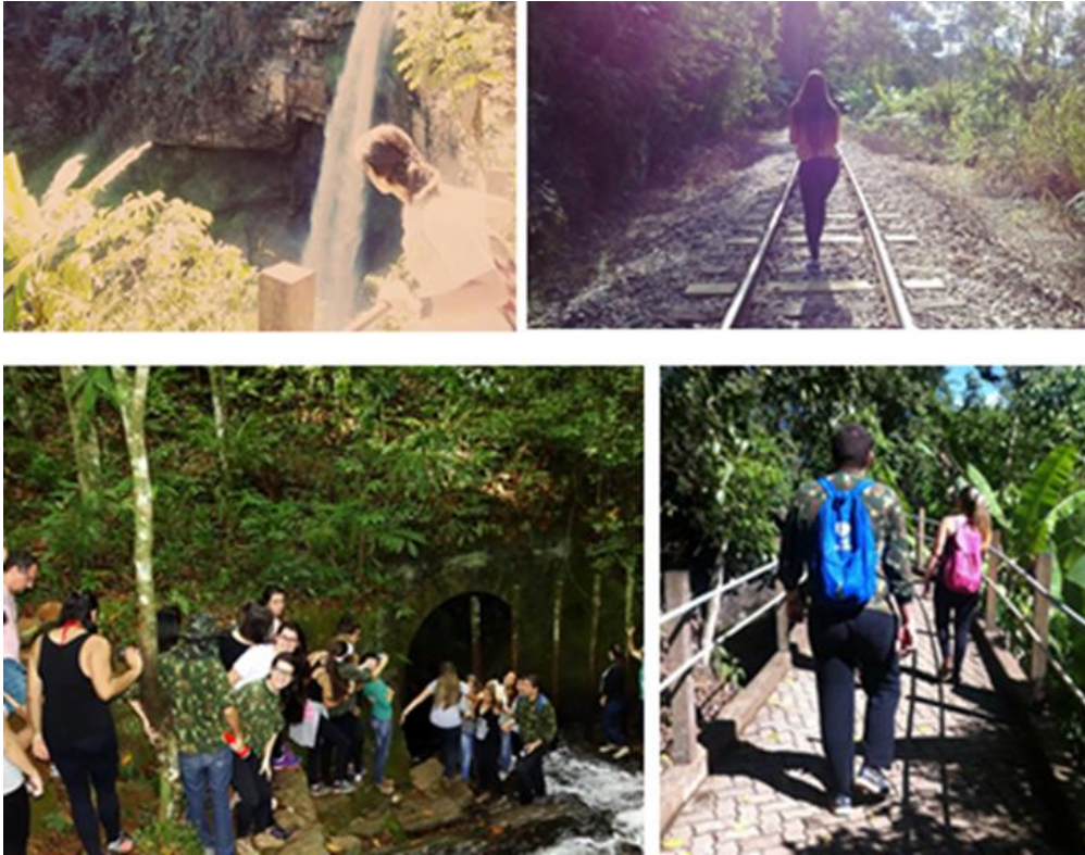
Figura 3: Imagens registradas em diferentes trilhas percorridas na localidade de Matilde, município de Alfredo-ES.

De acordo com Silva; Vargas; Silva-Filho (2014, p. 24) os ambientes naturais capixabas são representados por ecossistemas distintos a distâncias curtas – montanhas, rios, praias e manguezais. Esses ambientes apresentam características marcantes com belezas naturais que encantam a todos que possuem o mínimo de sensibilidade às percepções variadas de cores e vida que brotam da água, das pedras e da terra.