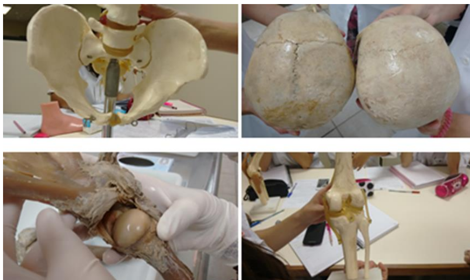
Figura 1: Peças anatômicas utilizadas nas aulas práticas. Arquivo pessoal.

Em outro momento, no laboratório de Botânica os alunos vivenciaram práticas num contexto experimental, em espaço tempo determinado ao observar o processo de condução da seiva por meio de líquido com coloração diferenciada percebendo a mudança na coloração natural das pétalas de uma flor branca (Tabela 2). Nesse sentido verifica-se que à medida que se inicia a mudança na coloração da flor, confirma-se a teoria da fisiologia vegetal, objeto de estudo, porém, desperta no estudante um olhar diferenciado das imagens coloridas que foram sendo produzidas. Assim, o professor está oportunizando momentos de discussões sobre o tempo, as transformações e ao mesmo tempo consegue instigar subjetivamente outras concepções e ideias para que seu aluno tire suas conclusões produzindo conhecimento.