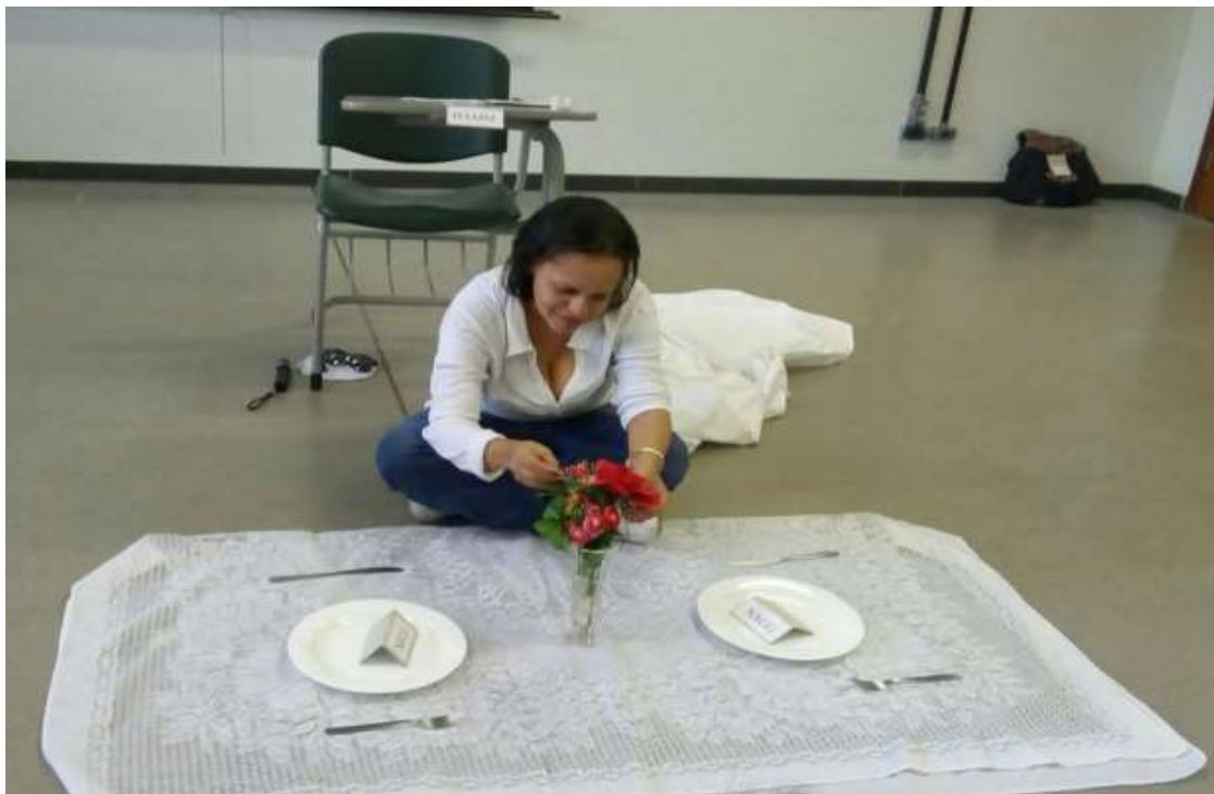
Figura 3: 3º Encontro do Primeiro Ciclo de Mediação de Leitura em LI na FC – Fonte: Os autores

A inserção desses elementos nos permite dizer que a performance da professora (P2) concentra-se em uma espécie de contextualização que ilustra o texto de referência. Já em um outro momento, ela convida um professor-participante para interagir com ela na performance . Ela indica gestualmente à colega que suba na cadeira e leia um fragmento do texto previamente selecionado e a ação se repete com as posições entre elas invertidas. Quando a professora-mediadora nos relata a experiência, ela diz o que quis mostrar à colega no momento de interação com ela.