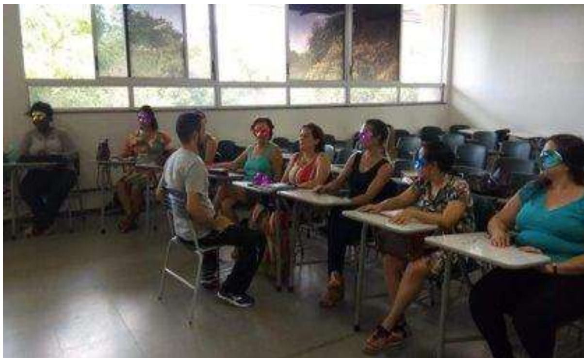
Figura 5: 4º Encontro do Terceiro Ciclo de Mediação de Leitura em LI na FC