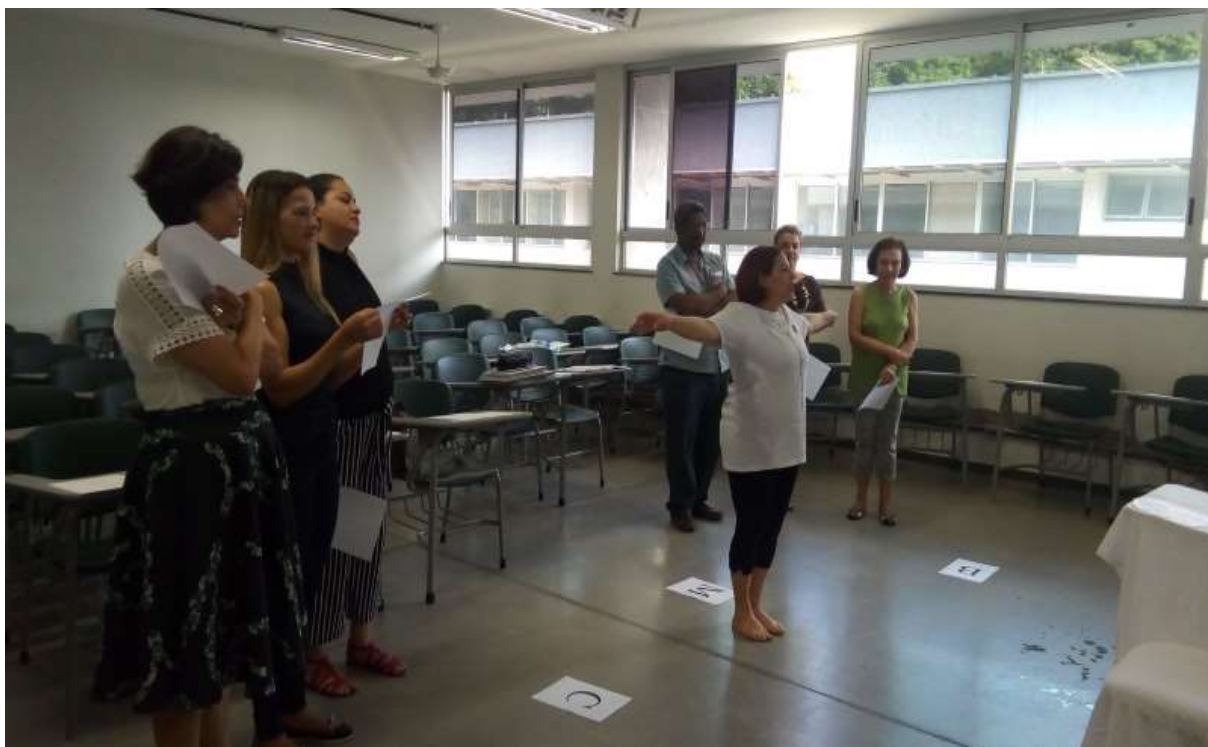
Figura 4: 5º Encontro do Segundo Ciclo de Mediação de Leitura em LI na FC